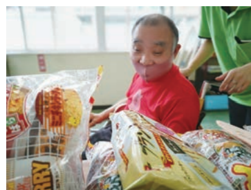
どれにしようかな?