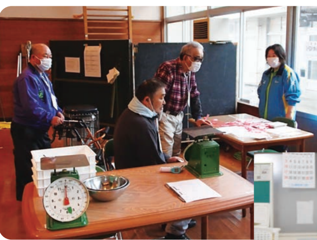
作業場としている体育館もチェックポイント