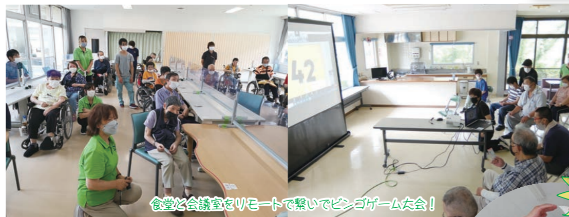
食堂と会議室をリモートで繋いでビンゴゲーム大会!