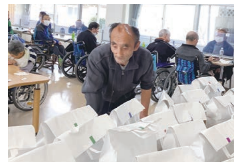
台の上にたくさん並んだ景品の中から自分で選んで頂きました