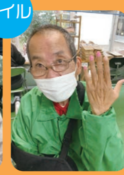
男でもオシャレは気にするよ