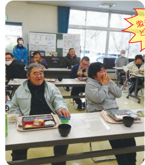
激辛パスタをどうぞ召し上げ!