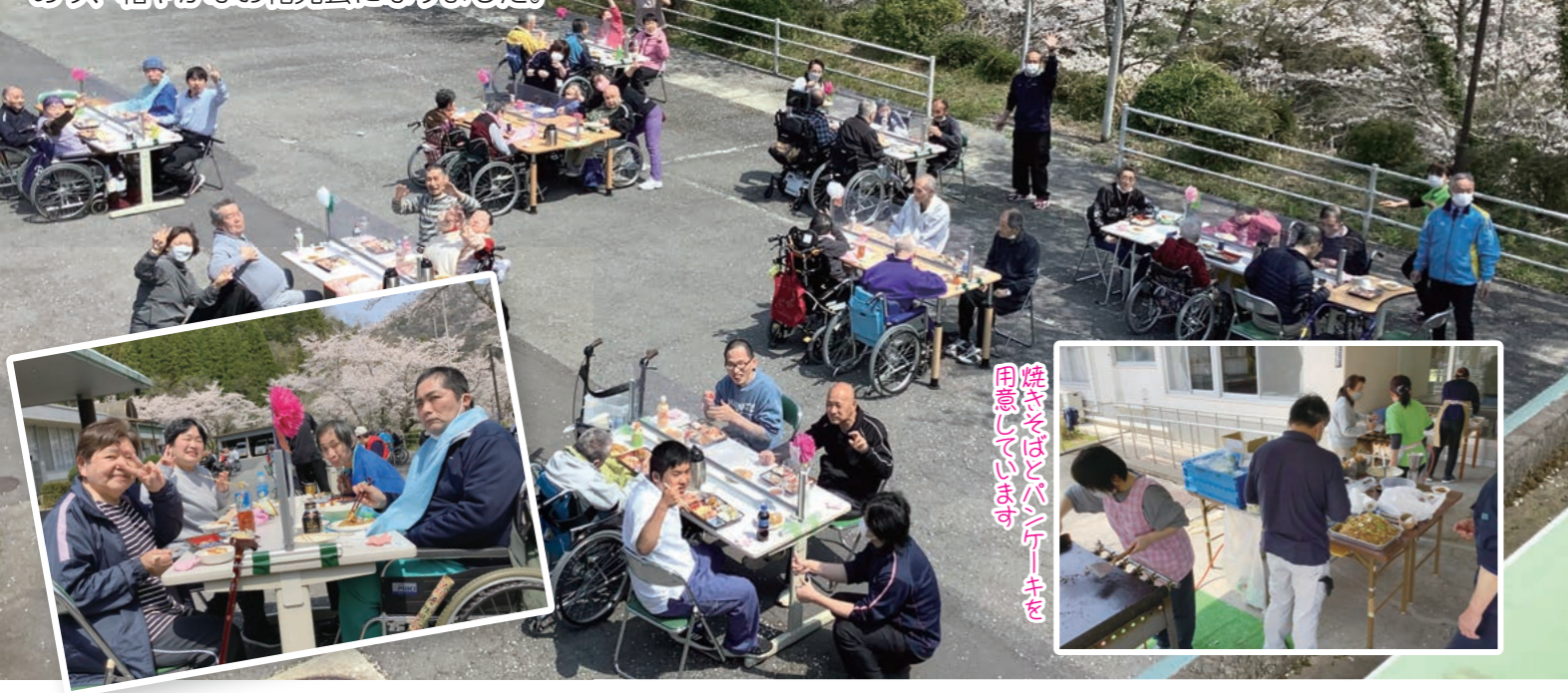
焼きそばとパンケーキをご用意しています

4月7日に邑智園の園庭にてお花見を行いました。 好天に恵まれ、満開の桜の下でお花見弁当の会食を楽しみました。 鉄板で作った熱々の焼きそばとミニパンケーキもあり、和やかなお花見会になりました。