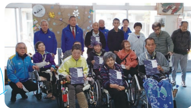
終わりに皆さんで記念撮影をしました