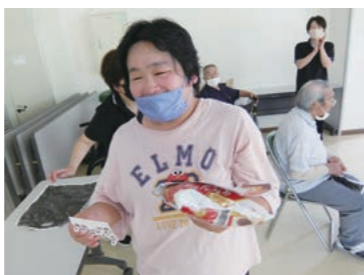
最後に当たって嬉し泣き!