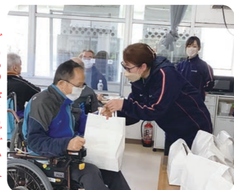
お話を聞いています