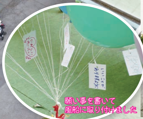
願い事を書いて風船に取り付けました

6月1日に開園42周年を迎えました。川本町の龍源寺杉山ご住職と代表者のみで法要を行った後、前庭に利用者の皆さんに集まっていただきバルーンリリースを行いました。風船に願いを込めて一斉に空に飛ばすと、色とりどりの風船がとても綺麗でした。美郷町役場や君谷交流センターの方々も来園され、写真撮影や取材をしていただき思い出に残る記念日となりました。