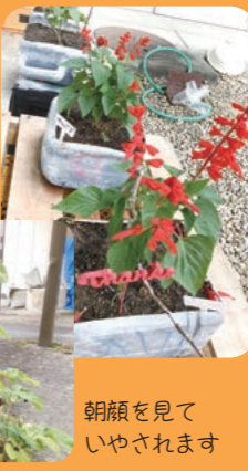
朝顔を見ていやされます